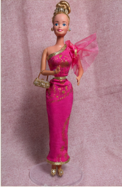
Diseñado para muñecas tipo Barbie de 11.5 pulgadas (29 cm).